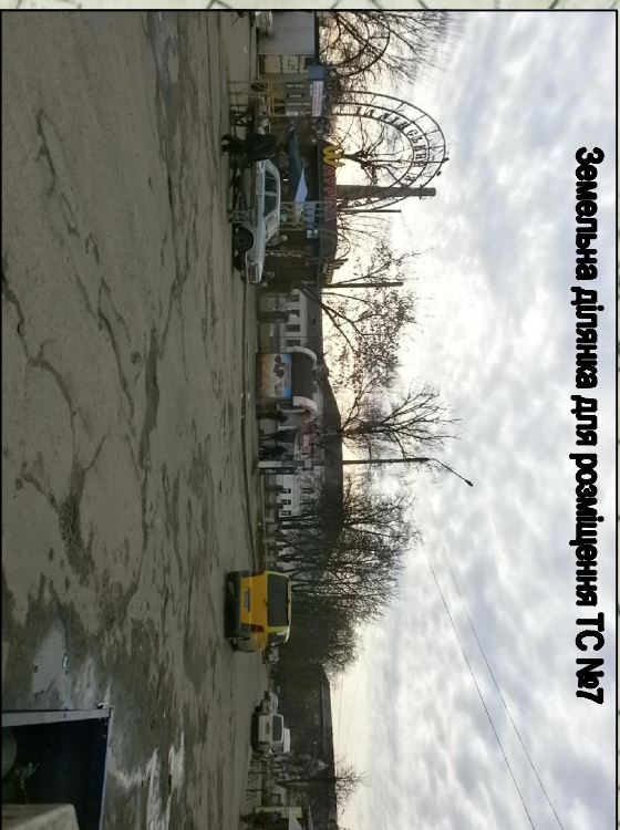
Земельна ділянка для розміщення ТС №7