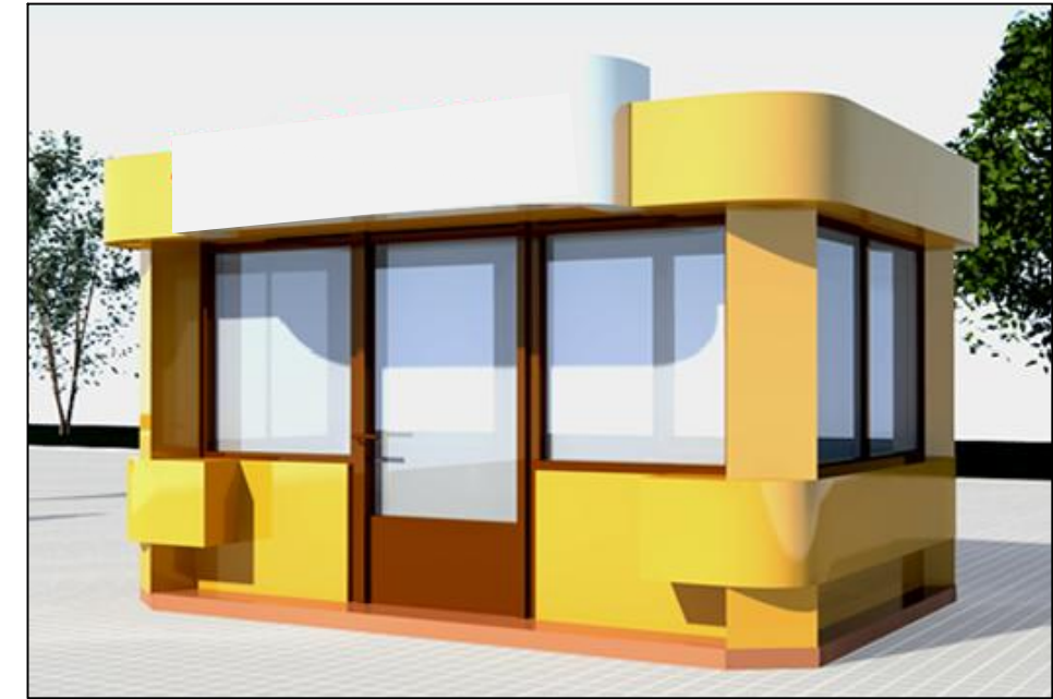
Фасад 1-2 (ТС №10)