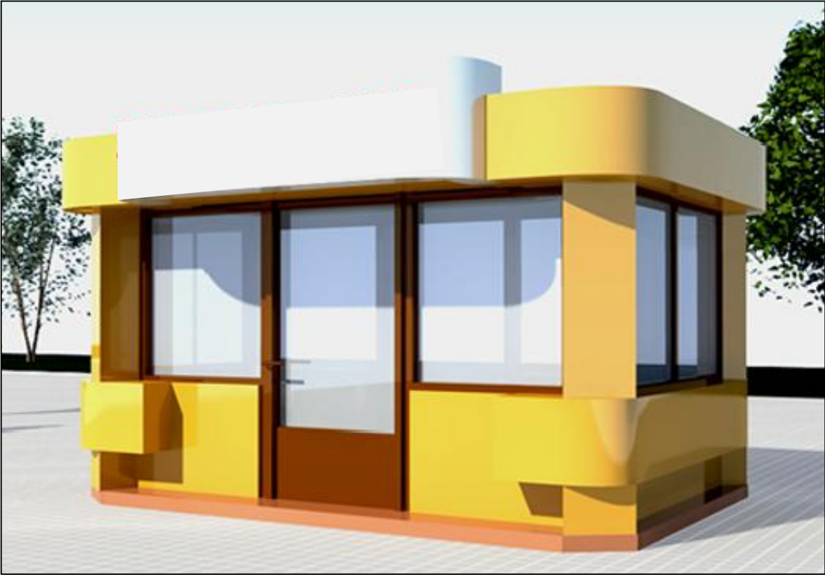
Земельна ділянка для розміщення ТС №13, 14