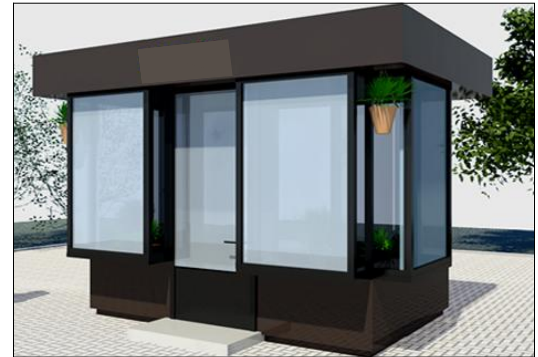
Земельна ділянка для розміщення ТС № 8